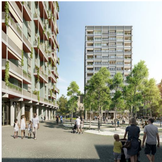
Siloplatz mit Baubereich I (links) und Baubereich K (rechts)